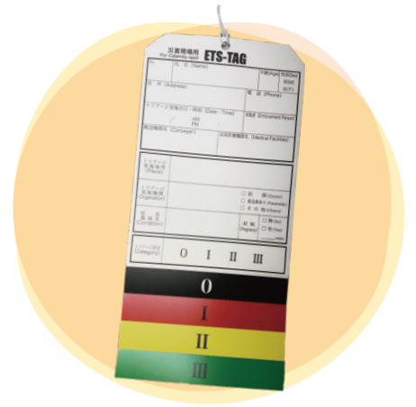
※災害時など多数の傷病者が同時発生した場合に、傷病者の緊急度や重症度に応じて適切な処置・搬送を行うため、治療の優先順位を決定すること

のトリアージ*などの訓練を行っています。災害時の食事や水分、薬剤・バッテリーなど考えることはたくさんありますが、少しずつ整理しています。つい最近、幕張メッセで行われた病院EXPO東京に参加し、非常食を見たり、試食をしたりしてきました。病院が少ない戸田市において河川の氾濫や地震の際に診療機能を継続できるよう対策を今後も進めていきます。